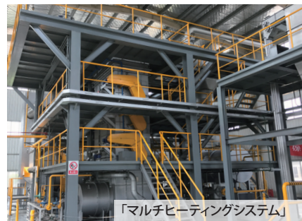
「マルチヒーティングシステム」